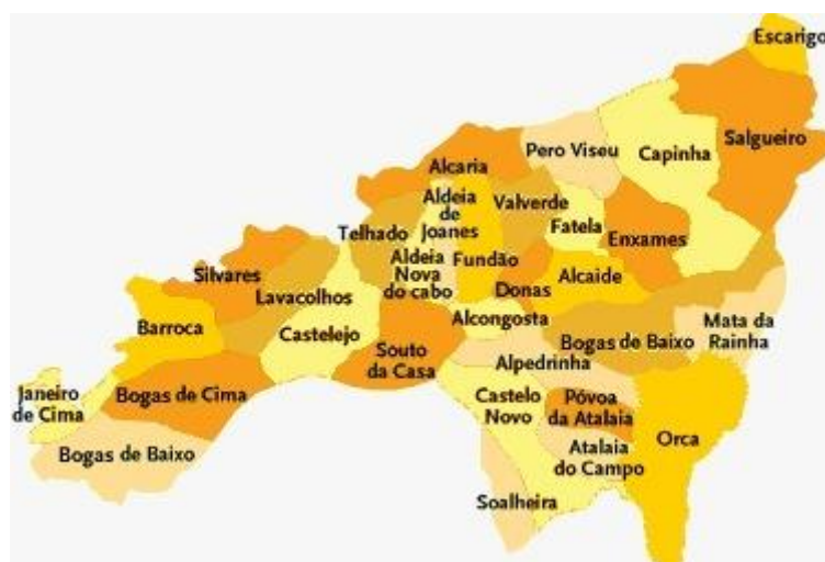
Figura 1. Mapa do Concelho do Fundão.

O Município do Fundão é parte integrante do distrito de Castelo Branco e situa-se na província da Beira Baixa, a região na parte central e interior de Portugal. O Município é limitado pelos concelhos de Sabugal, Belmonte e Covilhã (a Norte), Castelo Branco e Oleiros (a Sul), Idanha-a-Nova e Penamacor (a Este) e Pampilhosa-da-Serra (a Oeste). O Município do Fundão é constituído por vinte e três freguesias (a unidade territorial mais pequena em termos políticos e administrativos em Portugal): Alcaide, Alcaria, Alcongosta, Alpedrinha, Barroca, Bogas de Cima, Capinha, Castelejo, Castelo Novo, Enxames, Fatela, Lavacolhos, Orca, Pêro Viseu, Silvares, Soalheira, Souto da Casa, União de Freguesias das Aldeias do Xisto, União de Freguesias das Atalaias, Três Povos, União das Freguesias de Vale de Prazeres e Mata da Rainha e, União das Freguesias do Fundão, Valverde, Donas, Aldeia de Joanes e Aldeia Nova do Cabo.